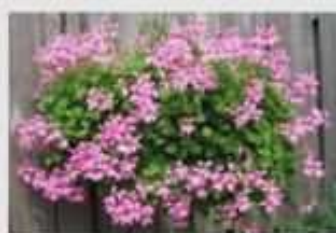
Geranio edera - Faccio sul serio

senza temere le crisi perché... con i fiori di S. Valentino