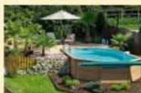
Il bisogno di privacy