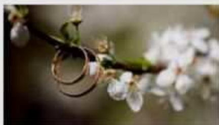
Fiori d'arancio - Vuoi sposarmi ?