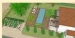
La planimetria di partenza