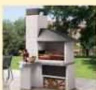
Gli elementi fissi