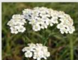
Achillea - Torniamo insieme