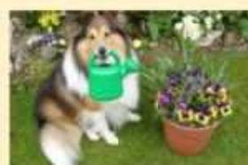
Chi vivrà in giardino