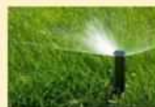
Come voglio irrigare