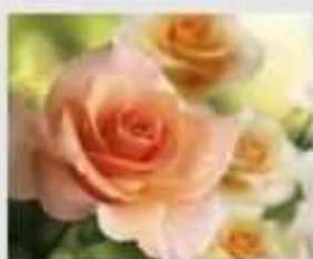
Rosa pesca - Ci mettiamo insieme ?