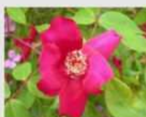
Rosa cinese - Facciamo la pace