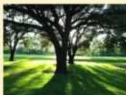
Zone di luce e ombra