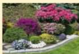
Le preferenze personali