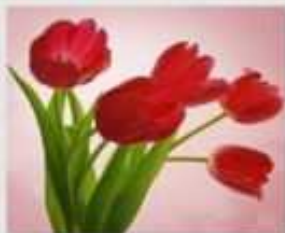
Tulipano rosso - Ti amo