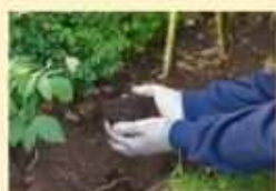
Il tipo di terreno

Per un buon risultato finale occorre valutare questi aspetti importanti